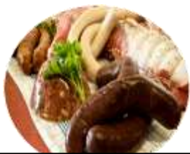
Boucherie Charcuterie Hervé WOLLBRETT Permanent

Pour vous tenir informés de l'actualité des commerçants, consultez le site internet de la commune :