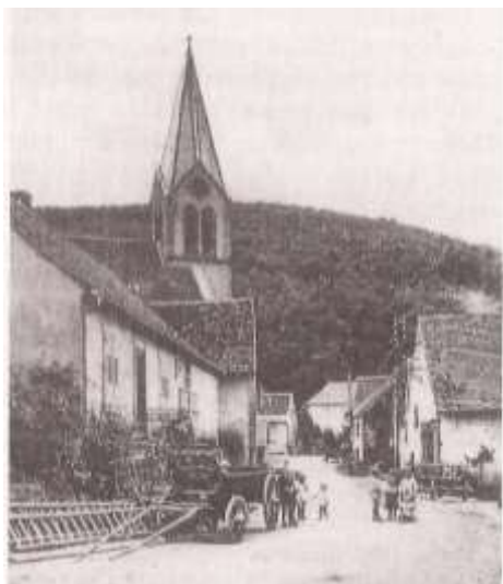
Carte postale de l'église en 1935, collection Lucien KLEIN

Carte annuelle de taxe sur les chiens de 1936 On y différencie les chiens d'agrément et chiens servant à la chasse ( 10Fr), des chiens de garde (3Fr).