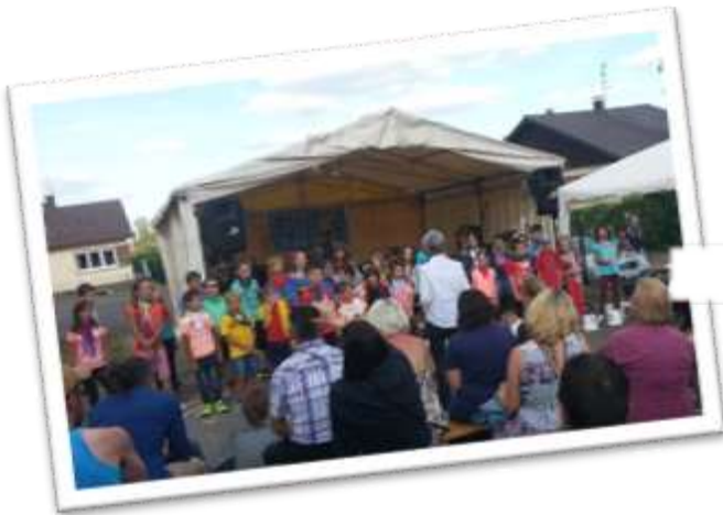
Fête de la Musique 2018

A nous de revoir nos animations pour les mettre le plus possible en adéquation avec les mesures sanitaires et garder ces moments conviviaux que vous appréciez tout en garantissant votre santé.