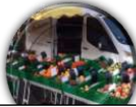
Primeurs EARL BRIDEL Permanent