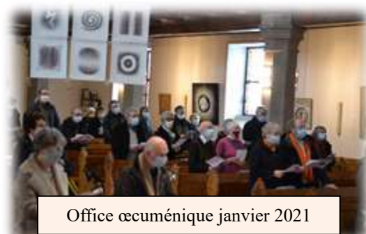
Office œcuménique janvier 2021

en communion et partage avec nos frères et sœurs catholiques de la communauté de paroisses du Pays du Haut-Barr : le dimanche 16 janvier dans le cadre de la semaine de prière pour l'unité des chrétiens et le dimanche 6 mars pour la Journée mondiale de prière , préparée cette année par les femmes d'Irlande du Nord, du pays de Galles et d'Angleterre.