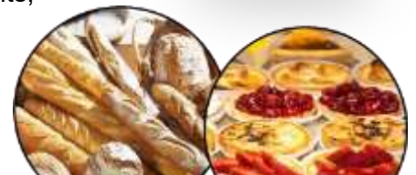
Boulangerie Pâtisserie MARTINI Permanent

En ce mois de décembre 2021, le marché sera fermé les 24 et 31 décembre 2021. Il reprendra normalement son activité le 07 janvier 2022.