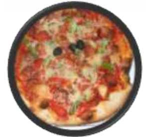
Food Truck Coco Pizza 1 er vendredi

le VENDREDI de 15h30 à 19h30 près de l'école