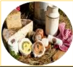
GAEC des Trois Chênes Permanent