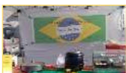
Traiteur brésilien Toque du Brésil 2 e vendredi

Vous pouvez aussi cliquer sur les logos de la version PDF de ce bulletin municipal disponible en téléchargement gratuit.