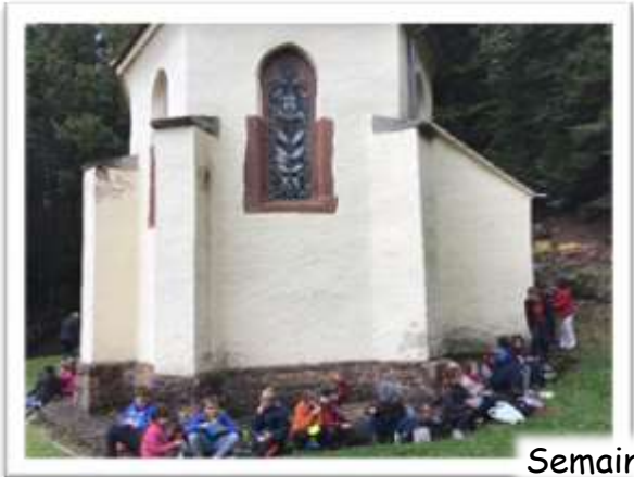
Semaine du goût en forêt

Au début de l'année 2021, les élèves de CE2-CM1-CM2 ont connu de belles journées enneigées à l'école d'Ottersthal. La cour de récréation s'était transformée en parc de loisir sur lequel les enfants se sont livrés à des activités de montagne telles que les glissades en luge ou la création de bonhommes de neige. Les élèves espèrent pouvoir remettre ça cette année !