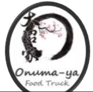
Gastronomie Japonaise 1 er vendredi